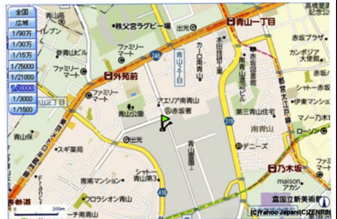
半蔵門線外苑前下車 ITOCHUビルを見て右折し 450m で管理事務所