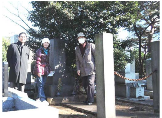
潮田千勢子の墓参