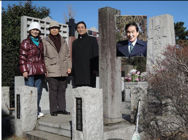
横の碑 大日本禁酒爺